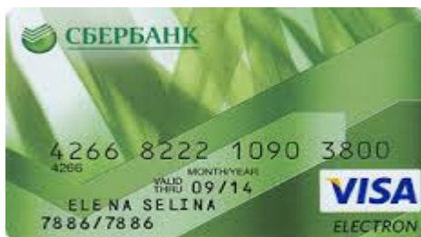
Рисунок 1 - Сбербанк-Visa Electron.